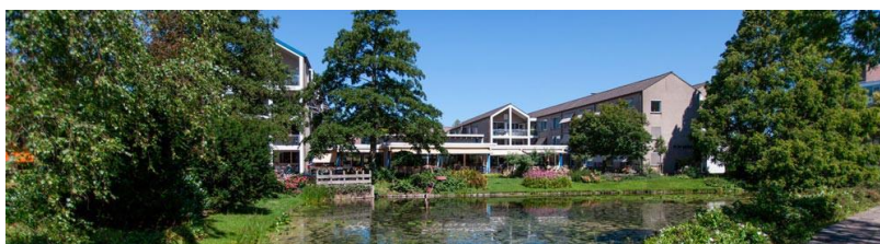
De Tien Gemeenten

De Tien Gemeenten is gelegen aan de rand het van oude centrum van Purmerend, recht tegenover het stadspark. De locatie bestaat uit 45 zorgappartementen, een afdeling met 14 plaatsen voor licht dementerende bewoners en 3 woongroepen. De locatie is omringd door een mooie tuin met diverse terrassen, waar het goed toeven is. In De Vijver, het buurtrestaurant van De Tien Gemeenten, kunnen bewoners en omwonenden dagelijks terecht voor koffie/thee en verse maaltijden uit eigen keuken.