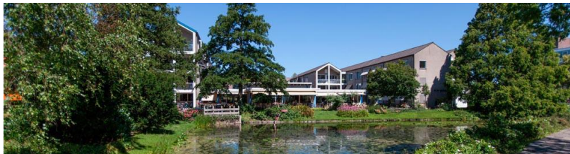
De Tien Gemeenten

De Tien Gemeenten is gelegen aan de rand het van oude centrum van Purmerend, recht tegenover het stadspark. De locatie bestaat uit 64 zorgappartementen en 3 groepswoningen. De locatie is omringd door een mooie tuin met diverse terrassen, waar het goed toeven is. In De Vijver, het buurtrestaurant van De Tien Gemeenten, kunnen bewoners en omwonenden dagelijks terecht voor koffie/thee en verse maaltijden uit eigen keuken.